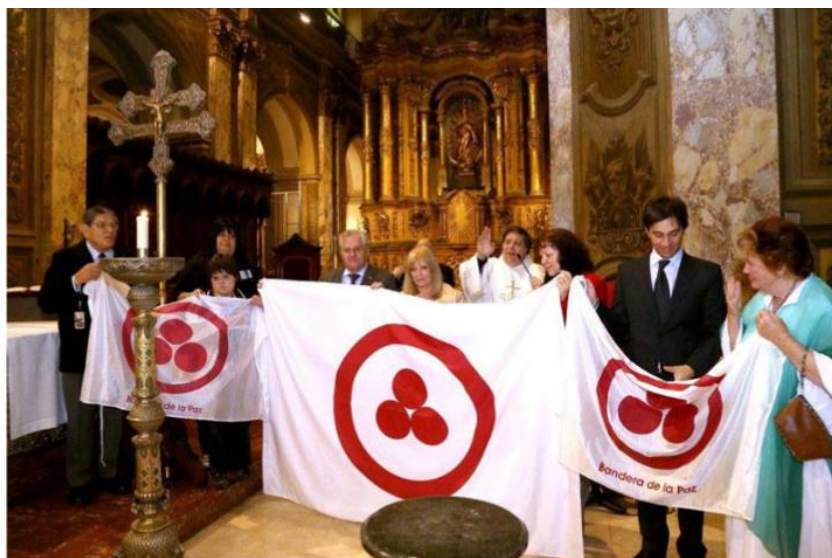
В Кафедральном Соборе Буэнос-Айреса состоялась интронизация Знамени Мира (введение его в статус государственного праздника), 2013 г.