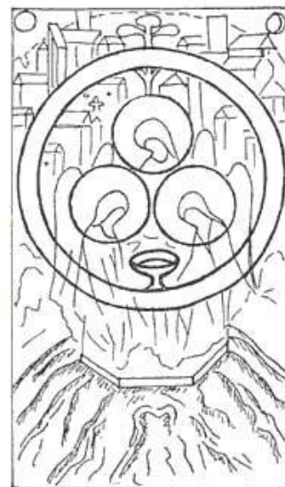
● Н. К. Рерих. Знак Троицы. 1932 г.

указанной выше публикации и отсутствие критического мышления у ряда читателей, не желающих самостоятельно размышлять и сопоставлять факты, дает простор кривотолкам. Вот это как раз об источнике вопроса. А сейчас постараемся кратко обрисовать реальную картину. Знак Знамени Мира встречается в истории (и датирован археологами) задолго до появления всех известных религий мира. Это прообраз Троицы, тех самых трех ангелов, который потом изобразил Андрей Рублев и другие великие иконописцы. То есть это Священный Знак. Ранее люди молились перед ним, когда не могли изобразить идею Троицтва на холсте. В современных словарях на сайте «Академик»: http://dic.academic.ru/dic.nsf/ruwiki/462025 подробно рассмотрена все основные аспекты этого символа (от исторических до современных). Так же рекомендуем подробную фундаментальную статью «Знамя мира в мировой культуре»: http://lebendige-ethik.net/index.php/stati/125-znamya-mira-v-mirovoj-kulture Во вложении к этому письму прилагаем нашу презентацию с изображением Знамени Мира на картинах выдающихся мировых художников, на храмах различных религий и священных предметах культа: http://www.roerich.com/iic/russian/ovs/trinity.ppt